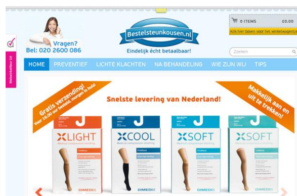
Figuur 2: De WebwinkelKeur sidebar button aan de linkerkant in beeld